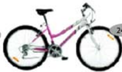
LADY SRAM MRX

18-käiguline kahe amordiga sportlik maastikuratas