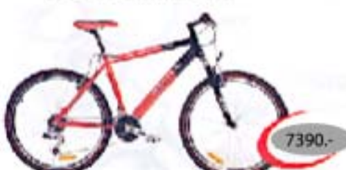
RACER SRAM 7.0

24-käiguline alumiiniumraamiga maastikuratas