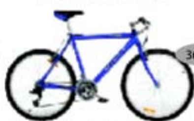
RELAX SRAM 3,0