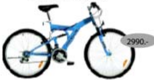
SRAM MRX FS