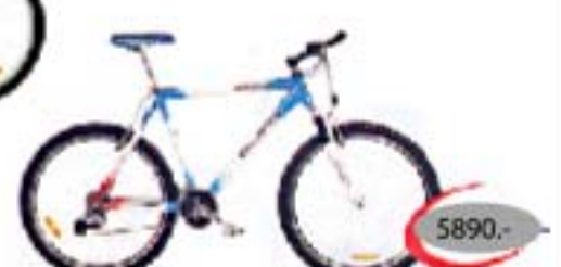
EXPERT SRAM 5.0