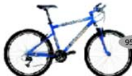
CORRATEC FREERIDE ALIVIO

24-käiguline esiamordiga alumiiniumraamiga võistlusuratas