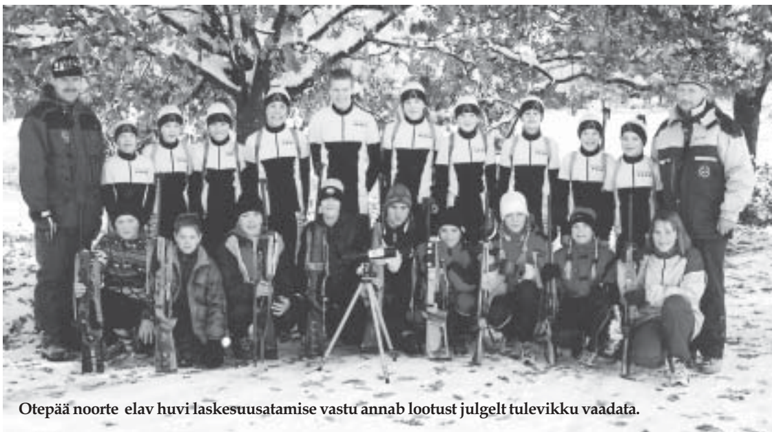
Otepää noorte elav huvi laskesuusatamise vastu annab lootust julgelt tulevikku vaadata.

Tulemuste seisukohalt on oluline iga sportlase individuaalne areng. Pjdestaalikohiti on ainult kolm, aga ennast saab võrrelda ka treeningkaaslaste ja konkurentidega. Laskesuusatamises jõudsid