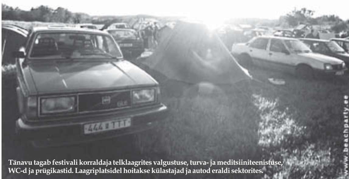
Tänavu tagab festivali korraldaja telklaagrites valgustuse, turva- ja meditsiiniteenistuse, WC-d ja prügikastid. Laagriplatsidel hoitakse külalastajad ja autod eraldi sektorites.

Müratase festivali ajal viiakse tervisekaitse normidega kooskõlla, heliseire aedlinnas viib iga 3 tunni järel läbi korraldaja tellitud helitehnika rendiga tegelev ettevõtte. Öörahu tagamiseks kehtestatakse piiratud müratasemega aeg kell 23-07. Reostuse vähendamiseks paigaldatakse Tamme puiesteele tualetteid ja prügikonteinerid, aedlinna tänavatele tuuakse korra kindlustamiseks täiendavad jalgsipatrullid.