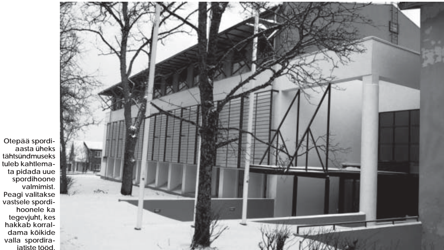
Otepää spordiaasta üheks tähtsündmuseks tuleb kahtlemata pidada uue spordihooone valmimist. Peagi valitakse vastsele spordihooonele ka tegevjuht, kes hakkab korraldama kõikide valla spordirajatiste tööd.

MAIS on mitmel viimasel aastal Otepää olnud kohtumispäevaks jooksjatele ning ratturitele. Sellelgi aastal anti Tehvandi suusastaadionilt start Tartu nelikürituse avaalale – 23km pikkusele jooksumaratonile. 2 nädalat hiljem läbisid Otepääd Tartu rattaralli osalejad. Mai-kuus võisid taas rõõmustada ko-