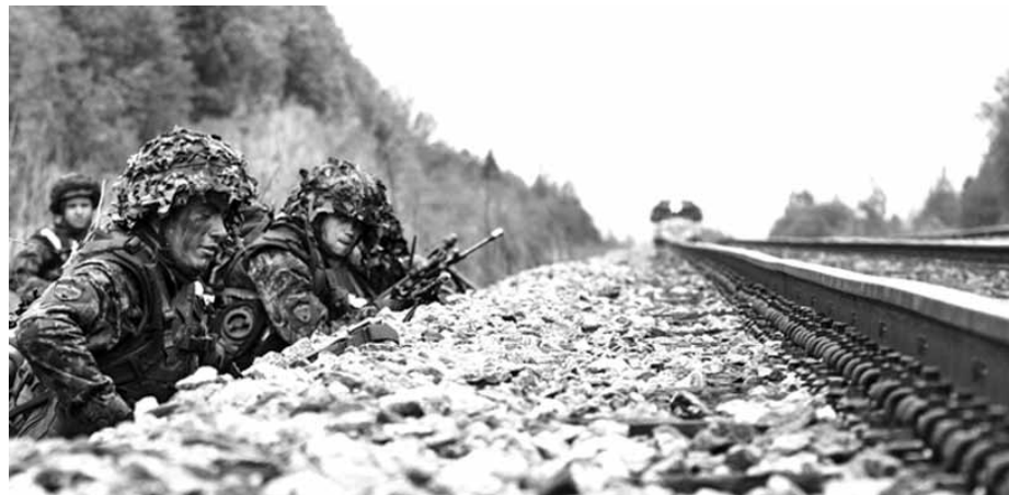
Eelmise aasta Kevadtorm.

Õppus Kevadtorm hõlmab tänavu Põlva, Tartu, Valga, Viljandi ja Võru maakondi. Viimati toimusid samased manöövrivõtted seal 2005. ja 2011. aastal. Kõikjal eespool nime-