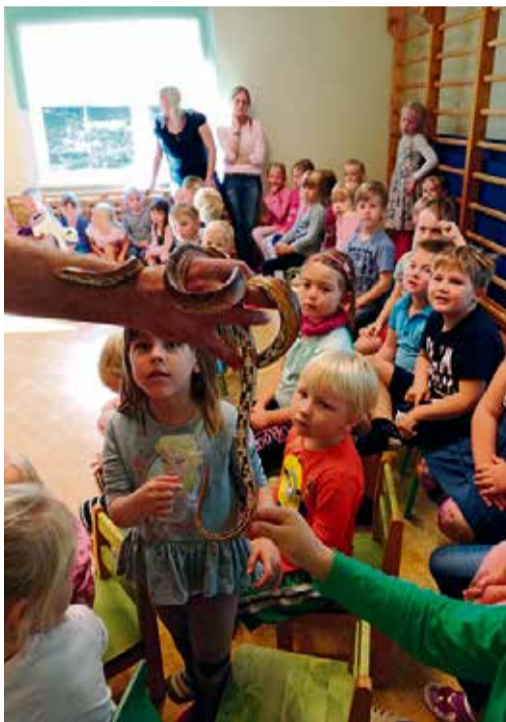
Fotol tutvuvad võrukaelad maoga.

Otepää lasteaia õppealajuhataja MERIKE ENNOK