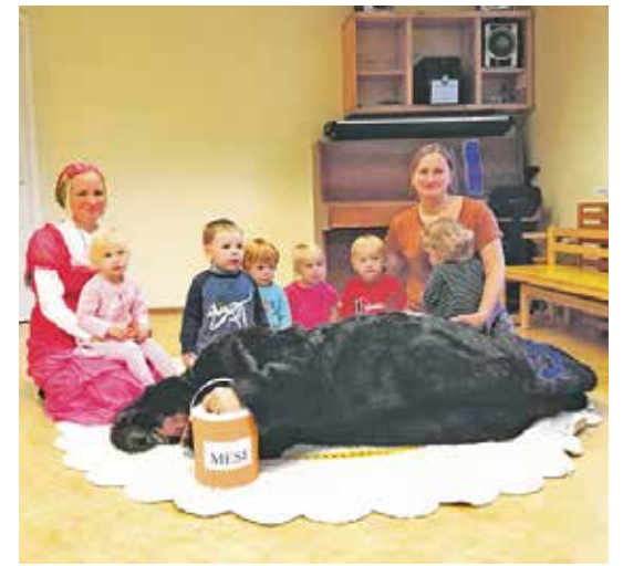
Korraldajad koos karuotiga.

Kui MürakARUD, Maru-Mürad ja KaisuKARUD ühel novembrikuu hommikul saali läksid, leidsid nad põrandalt põõnamast metsaoti. Kuigi mardikuul oligi rühmade õpetegevuse fookuses karu, said lapsed siiski üllatuse osaliseks.