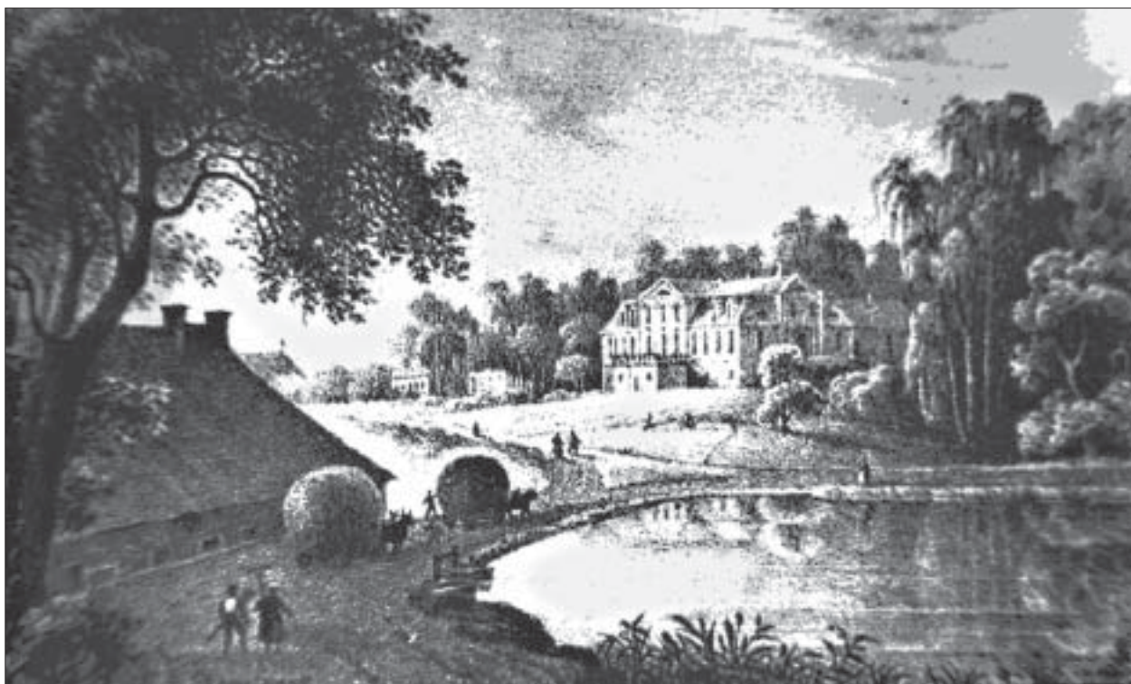
Kuigatsi mõis: F. S. Sterni gravüür XIX sajandi II poolest

hinnang oma piirkonna olukorrale. Selleks toimus koosolek, kus panime kirja piirkonna tugevused-nõrkused ja võimalused-ohud ning püüdsime anda nendest lähtuvalt hinnangu olukorrale. Esiialgu olime üpris nõutud ja leidsime rohkem halba kui head, hiljem olime hoopis optimistlikumad ja teathtelisemad.