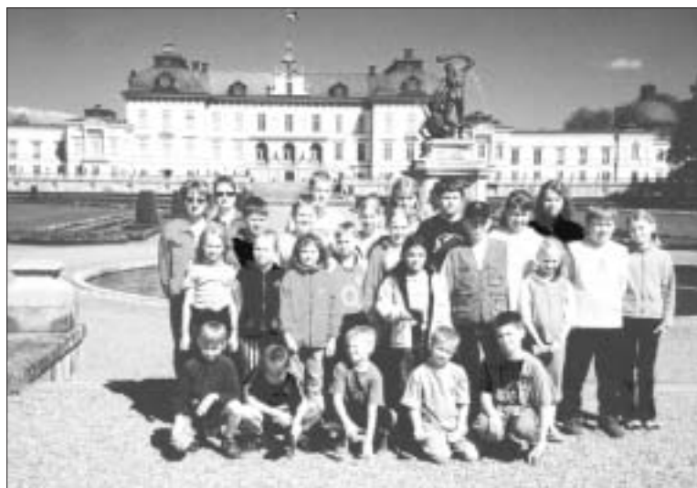
Drottningholmi lossi ees, kus Rootsi kuningapere alaliselt elab.

Otepää gümnaasiumi rahvatantsijate grupp käis 26.-29. mail Rootsi kuningriigis kontsertreisil. Kohale jõudes esinesime Västboda koolis. Kuigi seal oli streik, võeti meid ikkagi lahkelt vastu. Meile tutvustati koolimaja ja koolikorda. Pärast kooliga tutvumist võtsime suuna Drottningholmi lossi, kus Rootsi kuningapere alaliselt elab. Järgmisena külastasime panoraamkino Cosmonova. Kinost väljudes võisime vaadata näitust. Saime teada, kui palju me erinevatel planeetidel kaalume.