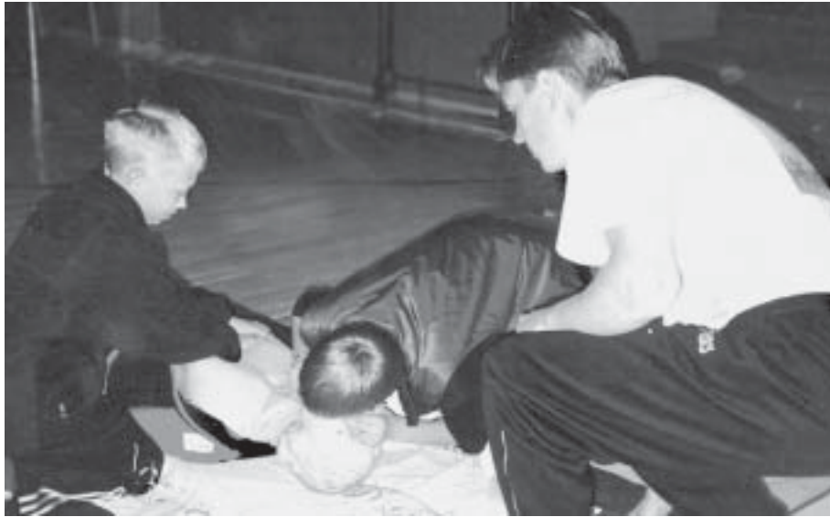
Otepää gümnaasiumi poisid harjutavad kunstliku hingamise tegemist.

Tänavu kevadel toimus Otepää gümnaasiumis 6.-7. klassidele suunatud projekt «Esmabikapp 2003».