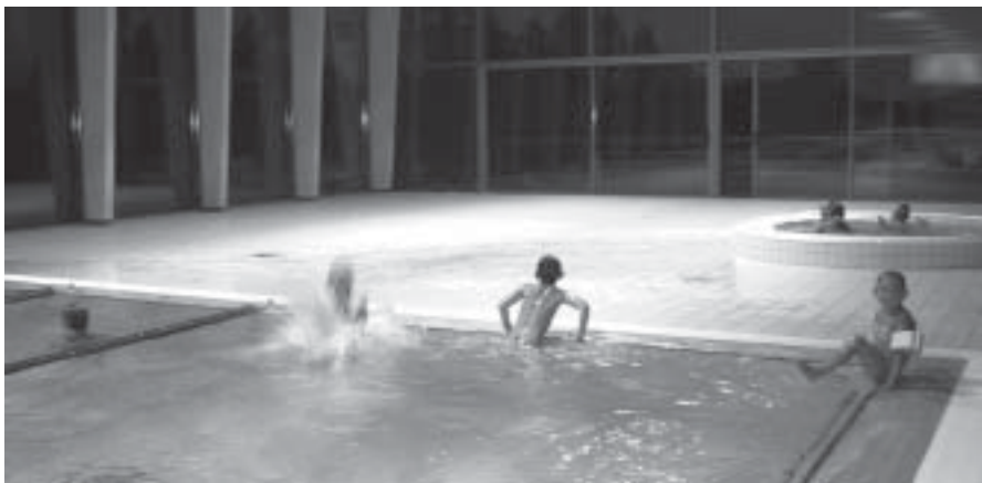
Pühajärve puhkekeskuse ujula on avatud kõigile. 13.septembril on huvilistele lahtiste uste päeva raames võimalik uue vabaajakeskusega tutvuma tulla, majaanekursioonid algavad igal täistunnil kell 14-18.

Ligemale aasta eest kunagise Pühajärve mõisa hobusetalli müüridele kerkima hakanud vabaajakeskus on tänaseks vastu võtnud juba sadu veemõnude nautijaid. 30 miljonit krooni maksma läinud ehitise esimesel korral paigutatakse maakonna ainuke bowlingusaal, samasse sisustatakse lähikaudel kaasaegne jõusaal. Uutesse tööruumidesse on kolinud taastusraviarstid, hambaarst, juuksur, kosmeetik ja maniküür-pediküür. Teisel korrusel