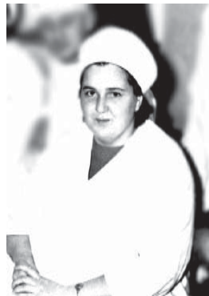
On mälestus helge ja puhas, on mälestus Sinust me jaoks. Ei kunagi muutu see tuhaks, ei iial me südameist kao.