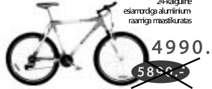
EXPERT SRAM 5.0 24-käiguline esiamordga alumiinium- raamiga maastikuratas