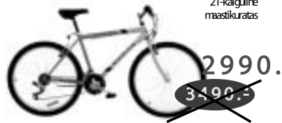
SRAM 4.0 21-käiguline maastikuratas