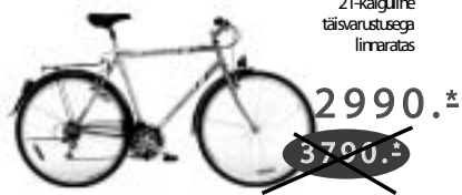
CITYMAN 21-käiguline täisvarustusega linnaratas