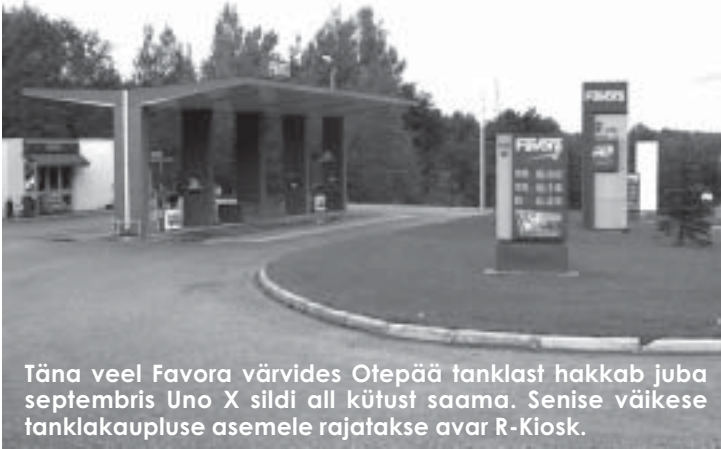
Täna veel Favora värvides Otepää tanklast hakkab juba septembris Uno X sildi all kütust saama. Senise väikese tanklakaupluse asemele rajatakse avar R-Kiosk.