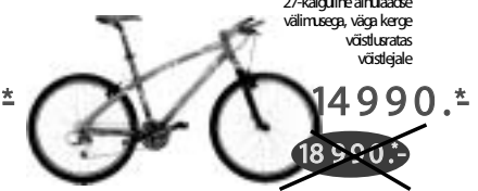
CORRATEC SUPERBOW FUN 27-käiguline ainulaadne väljumisega, väga kerge võistlusuratas võistlejale