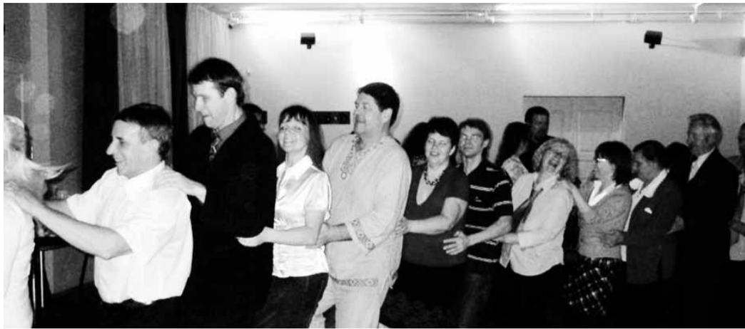
segakooriga Rõõm. Ühtlasi täname Aakre kooli ning Puka rah-

Lisaks on Rõõmu koosseisus andekaid pillimehi. Nemad moodustavad kapelli Supsti, kes pakkus pärast kontserti rahvalikku tantsumuusikat ning meelitas kõiki taidlejad jalga keerutama. Jääme ootama uusi toreid kohtumisi