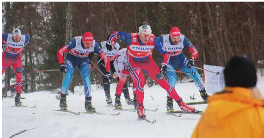
Meenutus kaks aastat tagasi toimunud Otepää MK-etapilt.

18. veebruaril asuvad Tehvandi Spordikeskuse staadionil taas starti maailma parimad suusatajad. Aegsasti saabunud lumi ja külmakraadid on lubanud ettevalmistustöödel kulgeda jõudsas tempos ning Otepää MK toimumiseks vajalikud suusarajad on juba heas korras. Lumelisa ootab veel vaid Tehvandi tõus.