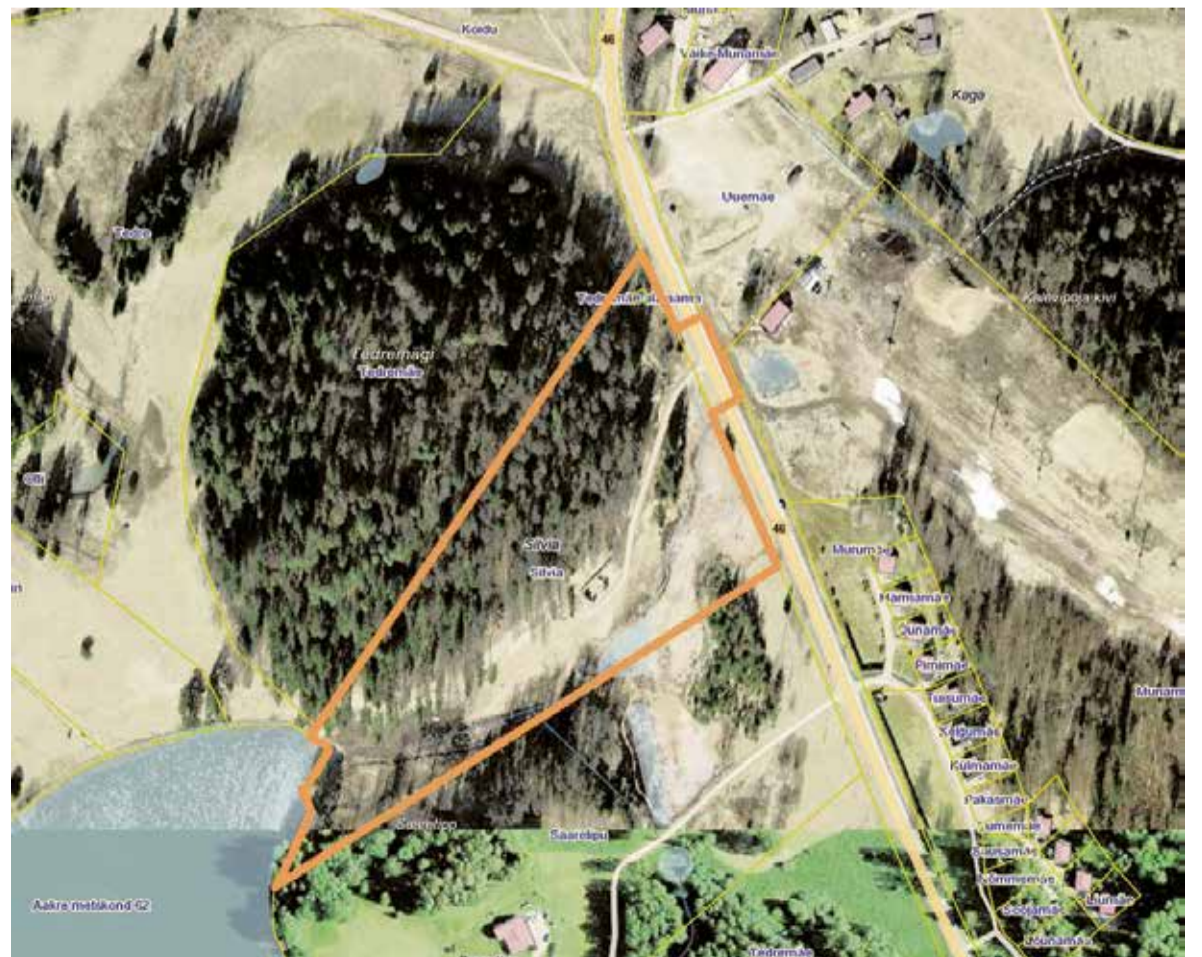
Planeeringuala piir (tähistatud oranžiga)

Täiendav info: planeerimisspetsialist Neeme Kaurov, neeme.kaurov@otepaa.ee, 76648020.