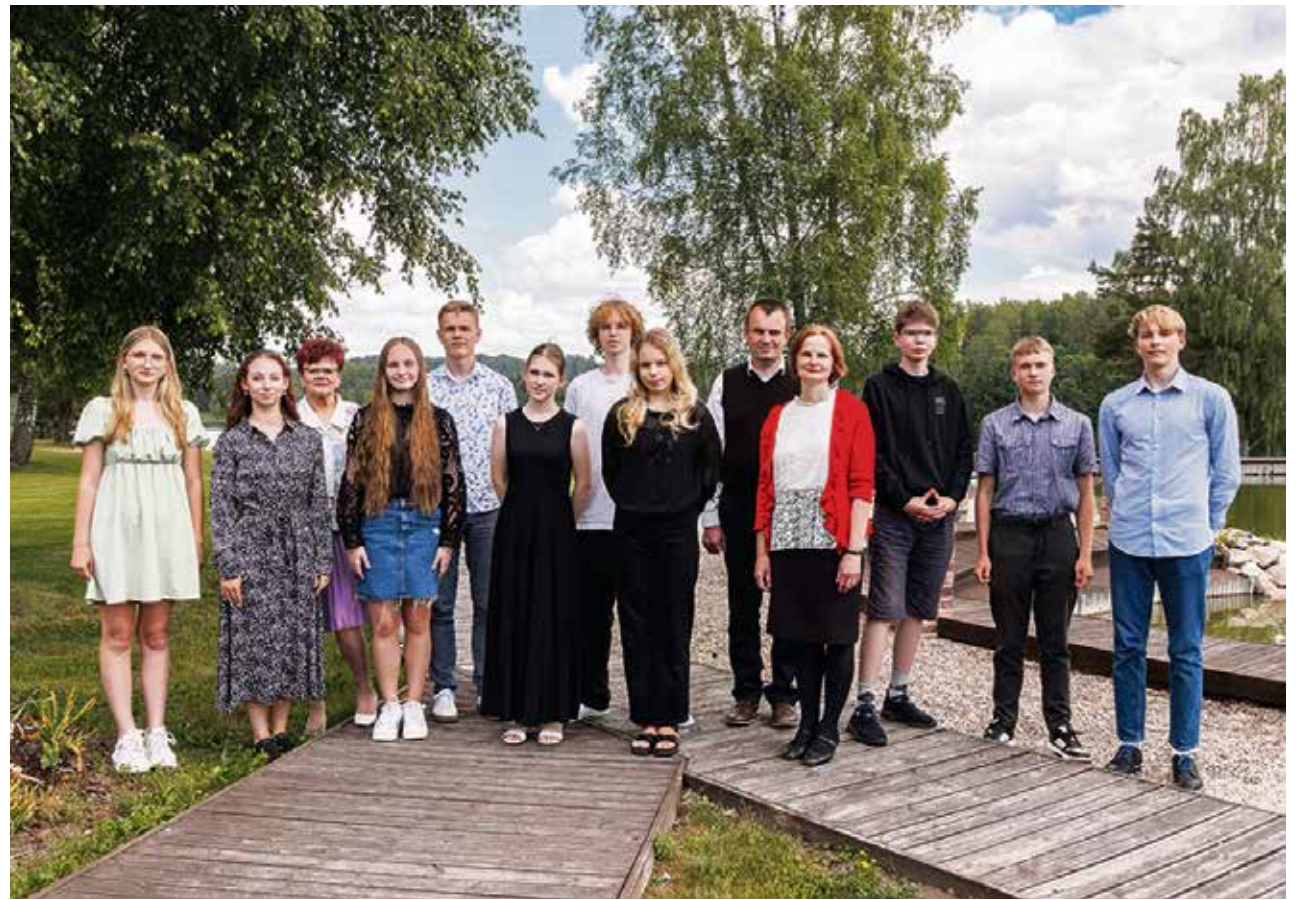
Pühajärve Põhikooli tublimad