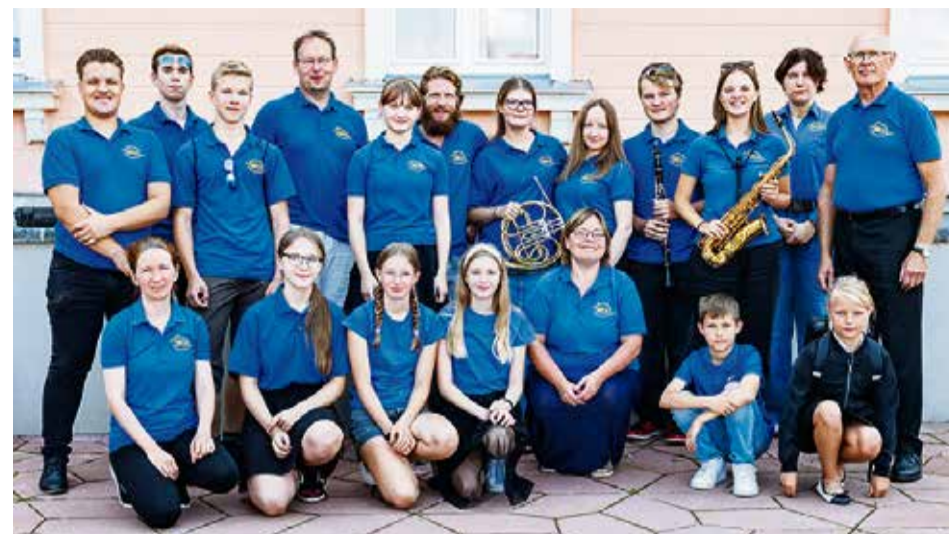
Otepää muusikakooli õpilased, vilistlased ja õpetajad – Pühajärve Puhkpilliorkester