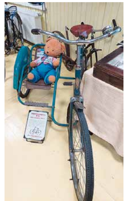
Külakorviga jalgratas (kuni 30 kilo kaaluvale lapsele) aastast 1967

tes, tuli päeva lõpus, mil külastasime Eesti Jalgrattamuseumi. Oli see alles ekskursioon kahe rattalise sõiduvahendi kujunemislukku. Lisaks rastele võis näha muudki, alustades ligi 330aastasest uhkest kellast ja lõpetades 90 aastat tagasi kasutusel olnud plaadimängijaga. Viimase tegi eriliseks see, et ühe plaadipoole kuulamiseks kulus üks nööel. Võrreldes tänapäevaga oli toona viiside kuulamine paras ettevõtmine. Pauk ei seisnenud ainult muuseumi eksponaatide rohkuses, vaid ka selles, et giid oli tõeline entusiast. Vähe sellest, et ta teadis liialdamata jalgrattamaailmast kõike, tundis ta end kodus ka mõisa-, sõja- ja transpordiajaloo.