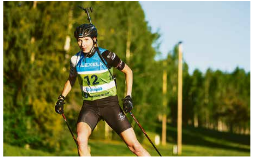
Eesti koondise esinumber Tuuli Tomingas asub Otepääl kaitsma suvebiatloni sprindi maailmameistri tiitlit.

Rohkem infot leiab võistluste kodulehelt biathlonotepaa.com .