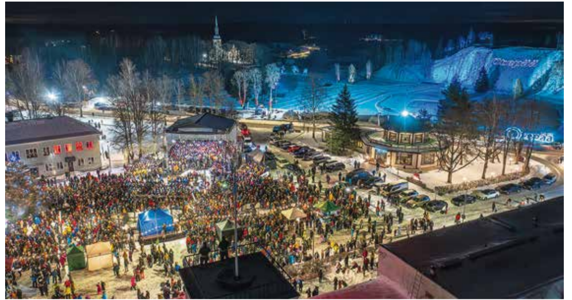
IX Otepää Talveöölaulupidu