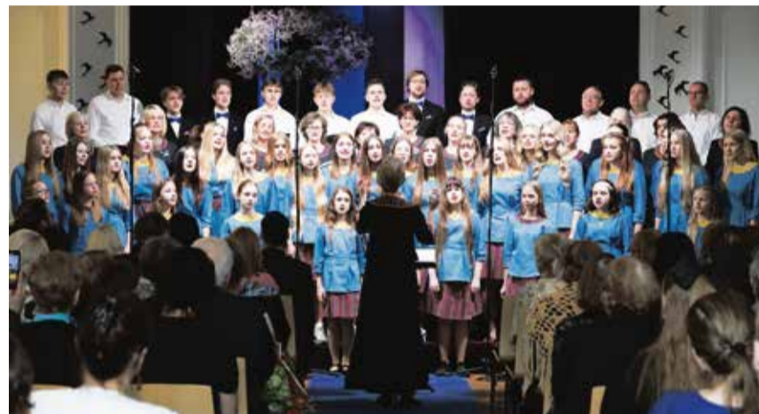
Kontsert Otepää kultuurimajas