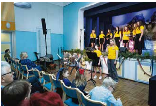
Sangaste kultuurimajas toimus kontsert-etenus „Eestlane olen ja eestlaseks jään“