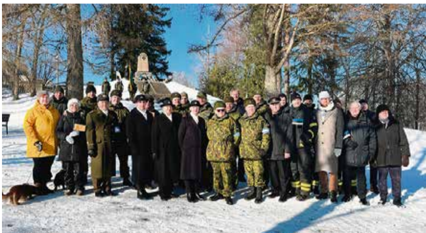
Vabariigi sünnipäeval Otepää Vabadussõja mälestussamba juures