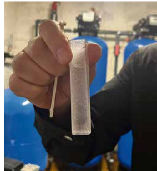
Vesi enne puhastamist ja pärast puhastamist